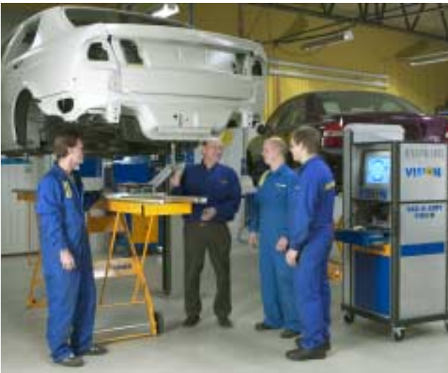
¡Con el servicio y soporte de Car-O-Liner, su Car-O-Tronic Classic siempre estará a la altura de las circunstancias!

Car-O-Liner ofrece servicio y soporte locales en más de 60 países. También hay disponible una certificación de control regular del sistema de medida para cumplir con normas de calidad locales. Car-O-Tronic Classic se suministra con un soporte de instalación de 24 horas, formación práctica y un certificado de calibración.