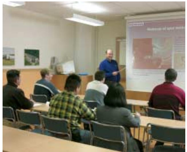
La Academia Car-O-Liner comprende un Centro de formación central en Kungsör, Suecia, un Centro de formación nacional en Wixom, Michigan, EE.UU., y en Rugby, Reino Unido, así como 50 distribuidores internacionales con Centros de formación locales.

La Academia Car-O-Liner ofrece programas de formación para técnicos de reparación de colisiones, profesionales de la industria de seguros e instructores técnicos. La formación está disponible en más de 50 centros de formación a cargo de nuestras filiales y distribuidores de todo el mundo. La inversión en formación aumenta los conocimientos generales del taller, y conlleva una mayor productividad y calidad en la reparación de colisiones, en definitiva una mayor rentabilidad.